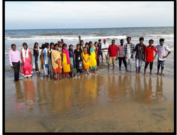
Education tour to Mamallapuram